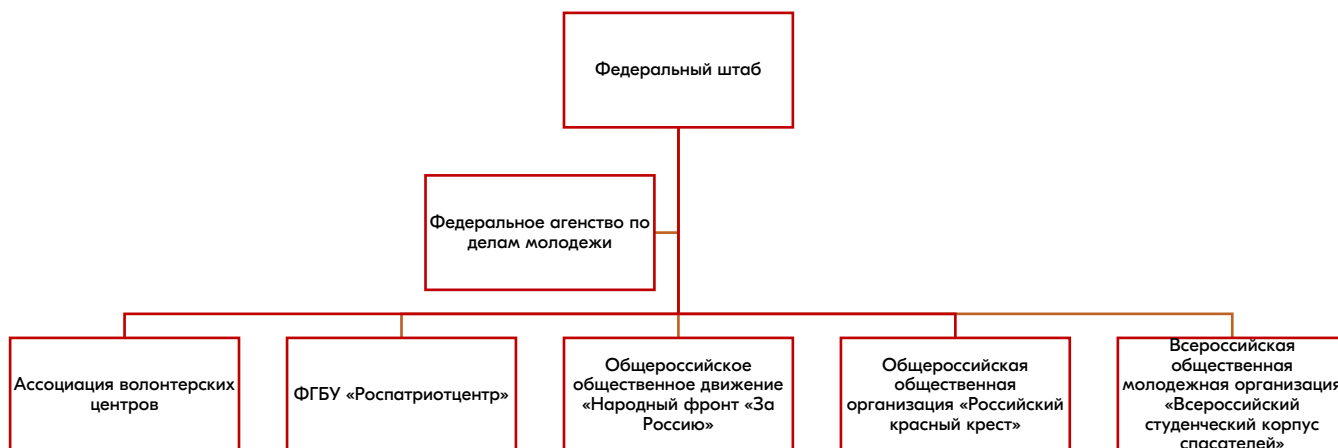
Схема 1. Федеральный штаб Общероссийского проекта взаимопомощи #МЫВМЕСТЕ по оказанию помощи семьям военнослужащих

Федеральное агентство по делам молодежи (далее – Росмолодежь) – является курирующим органом исполнительной власти, обеспечивающим эффективное взаимодействие между Правительством Российской Федерации, Администрацией Президента Российской Федерации и участниками федерального штаба Общероссийского проекта взаимопомощи #МЫВМЕСТЕ.