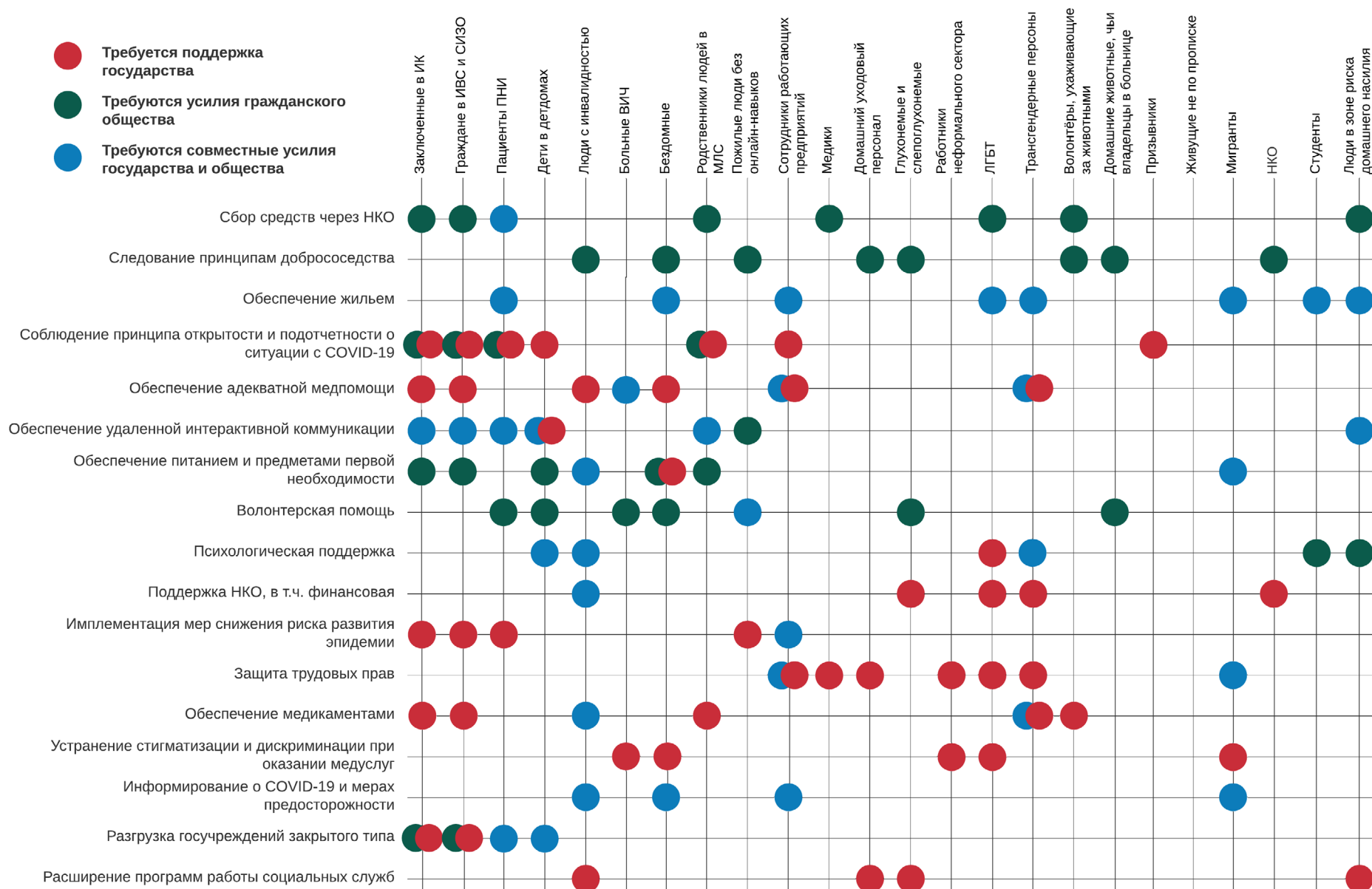
Рисунок 2. Меры поддержки, реализация которых поможет сразу нескольким уязвимым группам