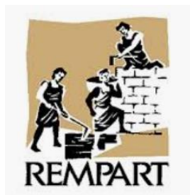
Французская Union REMPART

Сейчас волонтерство в сфере сохранения культурного наследия продвигают две крупнейшие организации: